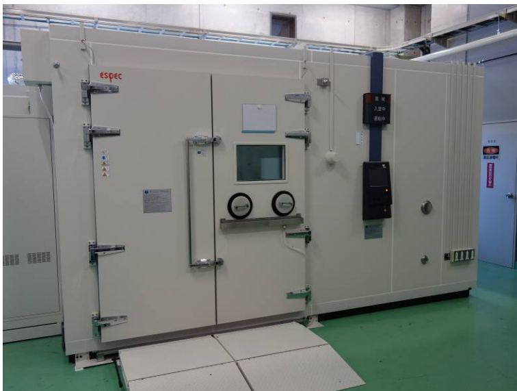
前面(観測窓/操作孔)